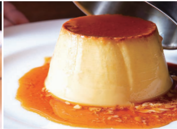
自家製プリン 680 (税込 748) Pudding