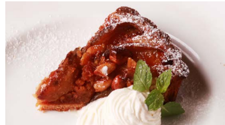
【季節限定】 いちじくとアーモンドの バイクドタルトケーキ 800 (税込 880) Baked Tart cake with fig and almond