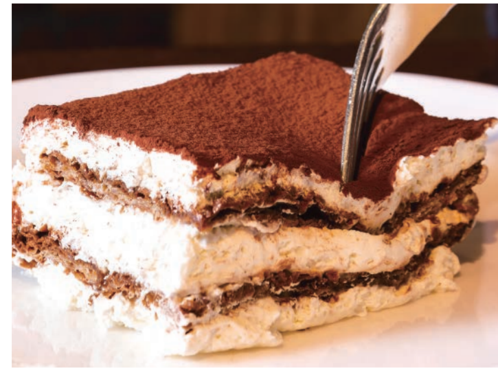
AGIOのティラミス 725 (税込 797) Tiramisu