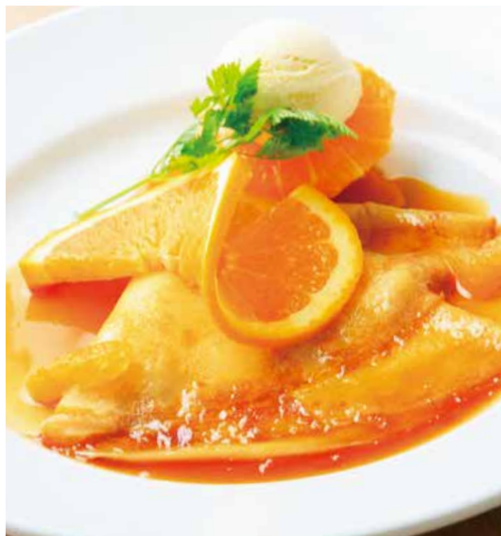
愛媛県産の柑橘類を丸ごとつけた クレープシュゼットとバニラアイス 1,280 (税込1,408)

Black cherry and gateau chocolate glass cake