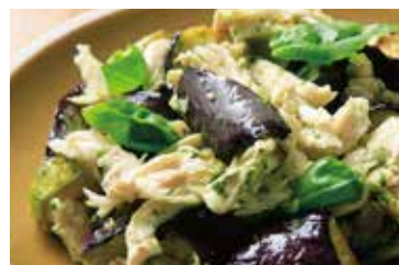
清流鶏とナスの バジルソースマリネ Marinated chicken and eggplant