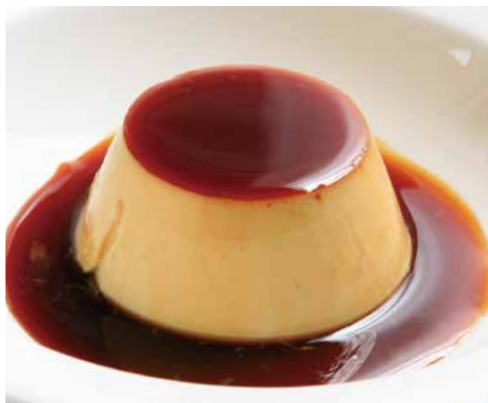
キャラメルプリン 545 Caramel pudding (税込600)

Grilled pineapple and fried doughnuts, coconut iced with caramel sauce