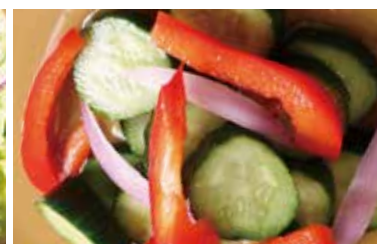
ギリシャ風 野菜のピクルス Pickled vegetables Greek style