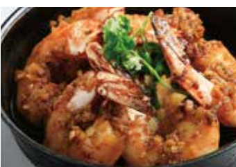
スパイシーガーリック シュリンプ Spicy garlic shrimp 1,150 (税込1,265)