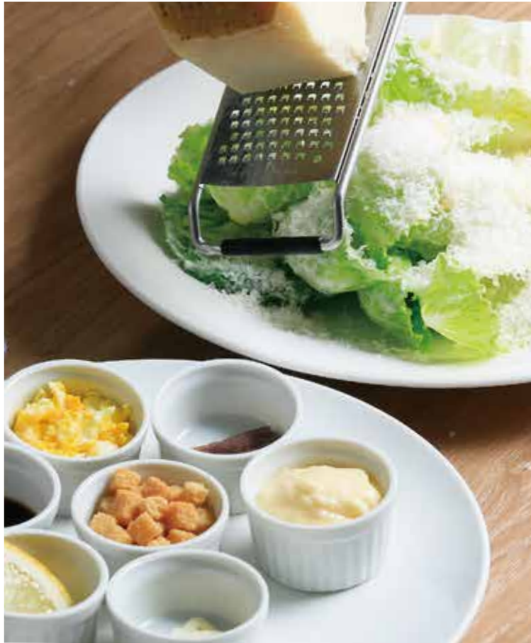
ザ・ギャレイの クラシックシーザーサラダ 1,550 Caesar salad (税込1,705)

お客様の目の前でドレッシングを仕上げ、出来たてのシーザーサラダをご提供いたします。たっぷりチーズをおかけします。