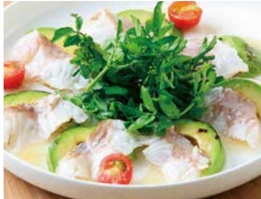
真鯛とアボカド 大根の 炙りカルパッチョ クレソンサラダ (税込1,958) ホースラディッシュのソース

大判の切り立てサーモンにハーブやレッドオニオン、 ケッパーを巻いてレモンをたっぷりかけてどうぞ！