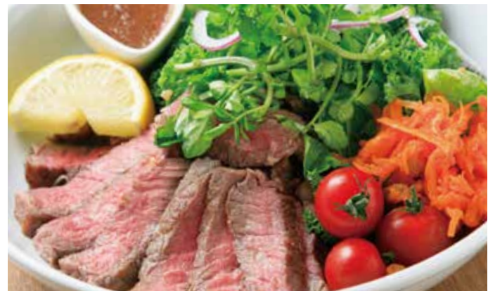
牛リブローズグリル ガーリックライスボウル 2,970 (税込3,267) Garlic rice bowl with grilled beef ribeye