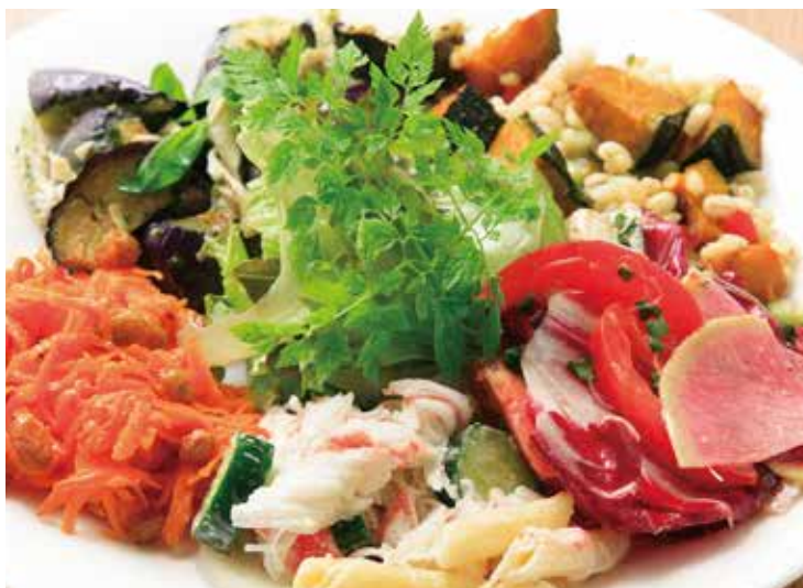
デリの盛り合わせ 3種 1,370(税込1,507) Assorted deli 5種 2,045(税込2,250)

グリーンサラダとハーブ、紅芯大根などさっぱりと酸味の効いた自家製のドレッシングでどうぞ。