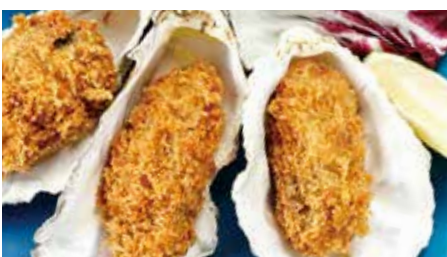
牡蠣フライ 3個 1,340 Fried oysters (税込1,474)