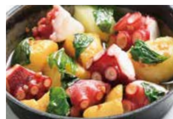
タコとジャガイモの バジルソテー Sautéed octopus and potatoes with basil 855 (税込940)