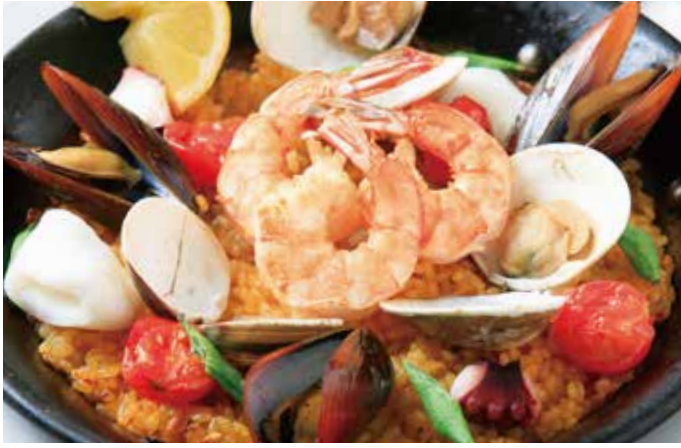
シーフード パエリア 1,960 エビ・ハマグリ・タコ・イカ・ムール貝 (税込2,156) Seafood paella