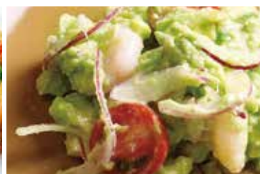
エビとアボカド トマトと赤タマネギ Shrimp and avocado