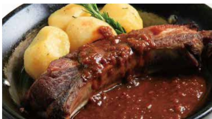
やまと豚 スペアリブのグリル 2,620 BBQ ソース (税込2,882)

Tuna Cutlet and grilled vegetables with avocado tartar sauce