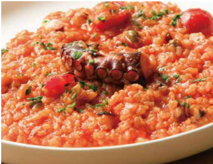
タコのトマトソース リゾット 1,665 (税込1,831) Risotto with octopus and tomato sauce