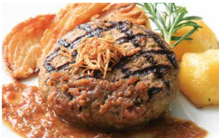
黒毛和牛ハンバーグとオニオンフライ 2,340 シャリアピンソース (税込2,574)