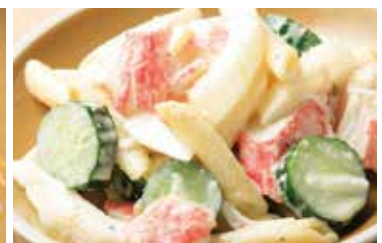
カニカマとセロリ キュウリ ショートパスタのサラダ Crab fishcake and short pasta salad