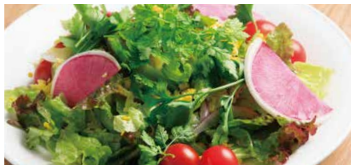
ガーデンサラダ 1,050 Garden salad (税込1,155)

お客様の目の前でサービスします。氷を敷き詰めたボウルを重ねて、シャキッと仕上げます。栄養価が高く、野菜の王様とも言われるケールとオレンジの甘味と酸味がよく合います。