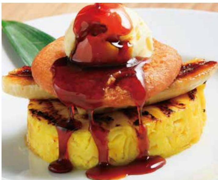
グリルパイナップルとバナナ 揚げたてドーナツ 1,020 ココナッツアイス キャラメルソース (税込1,122)

Crepe with citrus fruits and vanilla ice cream