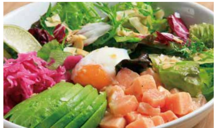
アトランティックサーモンのポキ風 アボカド 半熟卵のセライスボウル 2,090 (税込2,300) Rice bowl with salmon and avocado