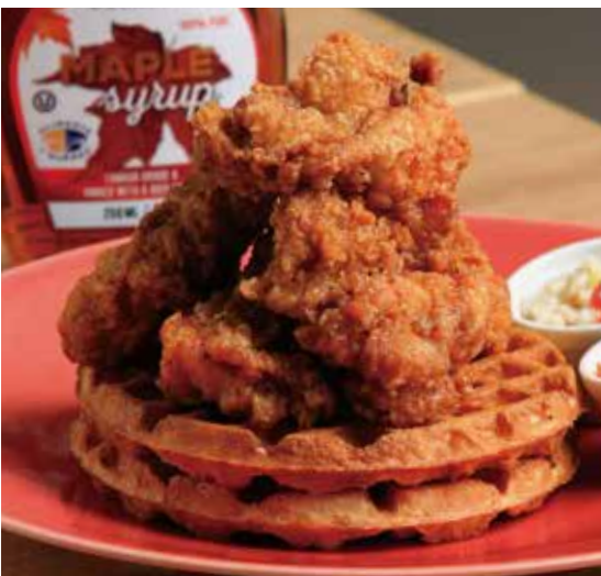
チキン & ワッフル 1,190 Chicken and waffle (税込1,309)

オリジナルのスパイスでマリネして揚げたチキンを ワッフルにのせました。お好みでメープルシロップを たっぷりかけてお召し上がりください。