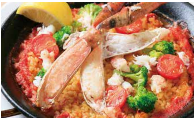
丸ズワイ蟹のパエリア 2,180 (税込2,398) Paella with crab