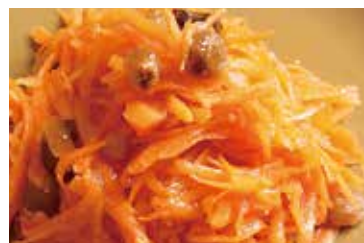
キャロットラペ Carottes rapees