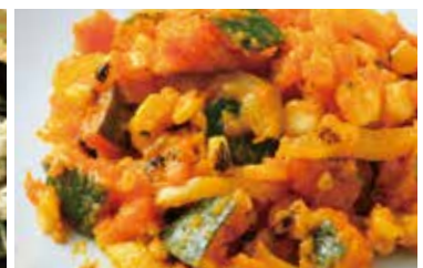
焼きトウモロコシとカボチャ 黄パプリカのサラダ カレー風味 Corn, pumpkin and paprika salad with curry