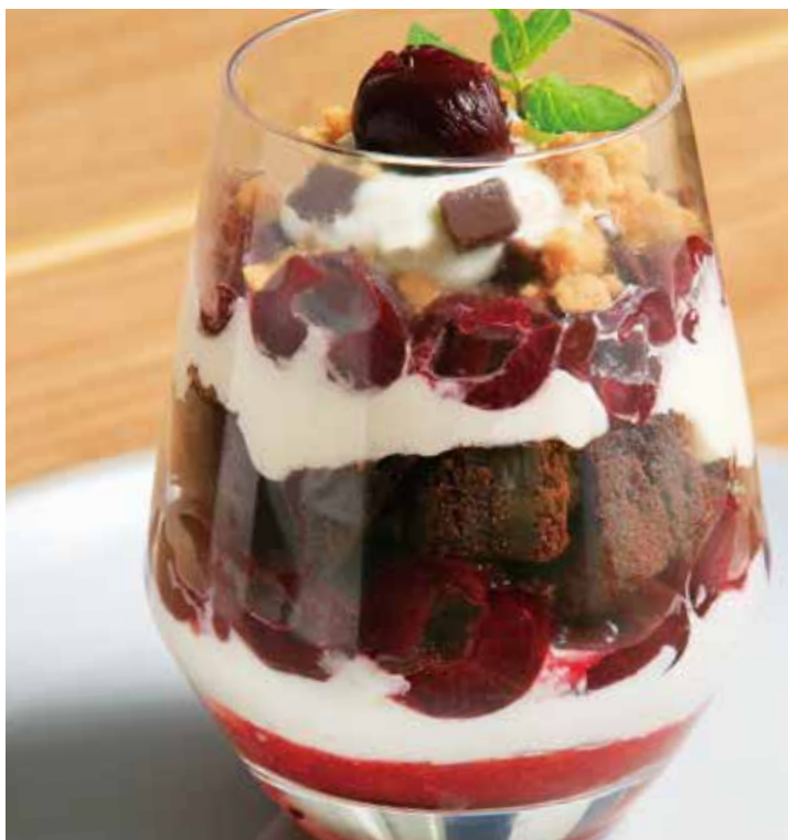
ブラックチェリーと ガトーショコラのグラスケーキ 1,390 (税込1,529)

Black cherry and gateau chocolate glass cake