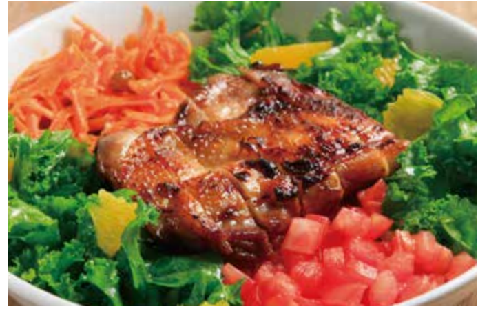
テリヤキチキンとケール トマトとキャロットラペ ライスボウル 1,740 (税込1,915) Rice bowl with "TERIYAKI" chicken & kale salad