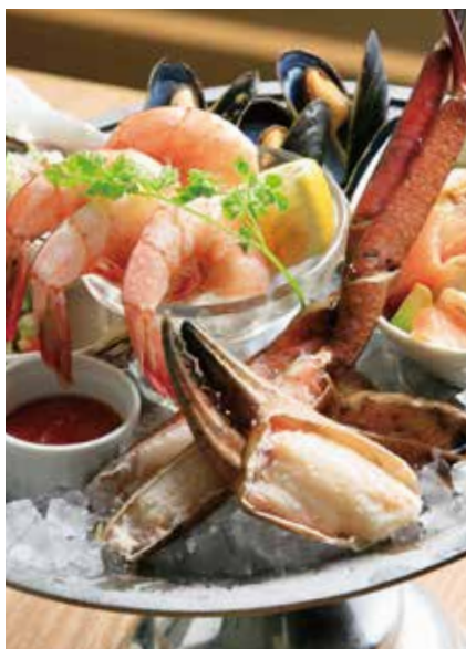
シーフード プラッター (2-3人前) Seafood platter

ひと晩かけて仕込むクジラ肉はしっとり として旨味たっぷり。脂質が少なく、鉄分、 コラーゲンを含む健康食です。