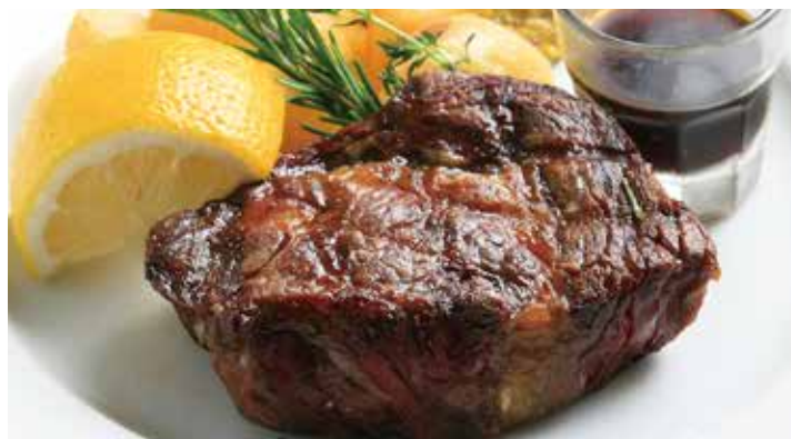
メキシコ産牛リブローズのグリル 200g 3,305 Grilled beef ribeye (税込3,635)