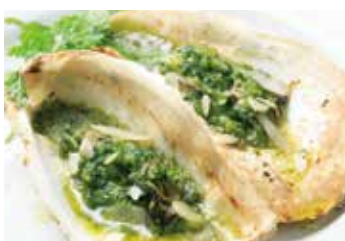
牡蠣のスチーム 香草バター Steamed oysters with herbed butter 995 (税込1,094)