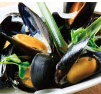
ムール貝の 白ワイン蒸し Steamed mussels with white wine