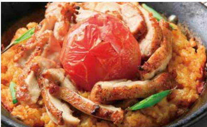
スパイシーチキングリルと丸ごとトマトのパエリア 1,740 (税込1,915) Paella with chicken grill and tomato