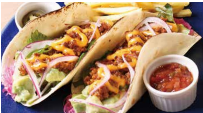
牛挽肉とチェダーチーズのタコス 1,825 (税込2,008) Ground beef and cheddar cheese tacos