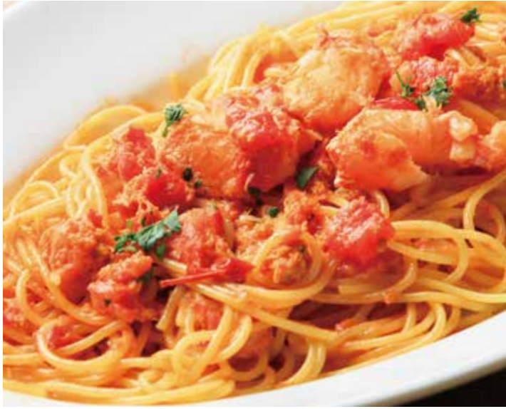
紅ズワイ蟹と丸ズワイ蟹の トマトクリームソーススパゲッティ 1,725 (税込1,898) Spaghetti with crab, tomato cream sauce