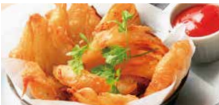
オニオンフライ 500 Onion fries (税込550)