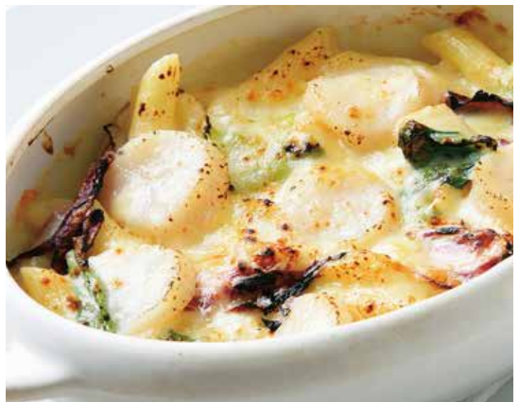
ホタテとロメインレタス 長芋のペンネグラタン 1,855 (税込2,040) Penne Gratin with Scallops and Romaine Lettuce