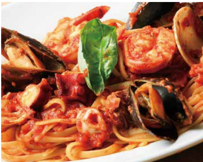
魚介のトマトソース "ペスカトーレ"リングイネ 2,050 (税込2,255) Spaghetti with seafood and tomato sauce