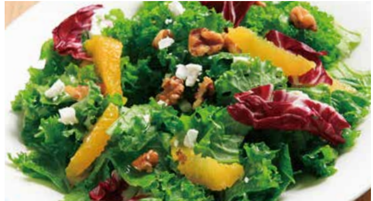
ケールサラダ オレンジとフェタチーズ 1,345 Kale salad (税込1,480)

お客様の目の前でドレッシングを仕上げ、出来たてのシーザーサラダをご提供いたします。たっぷりチーズをおかけします。