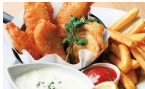
ザ・ギャレイの フィッシュ&チップス (税込1,512) タルタルソース Fish and chips with tartar sauce