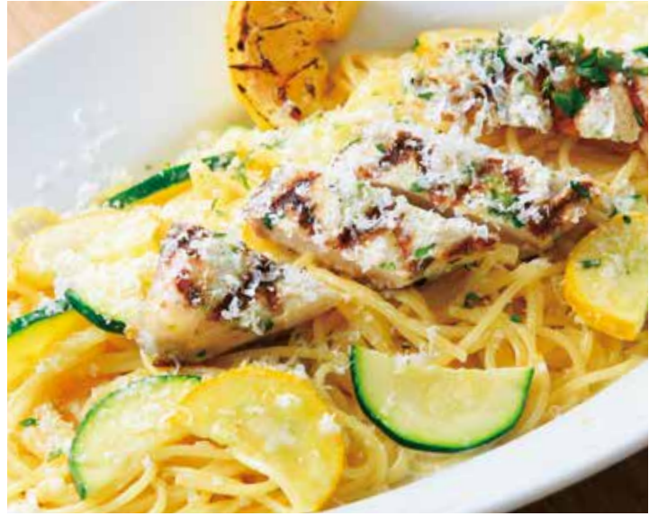
グリルしたカジキと2色ズッキーニの レモンクリームソーススパゲッティ 1,880 (税込2,068) 36ヶ月熟成のパルミジャーノ Spaghetti with grilled swordfish and zucchini in lemon cream sauce