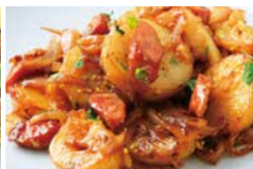
北海道粗挽きウインナーとポテト バルサミコ&粒マスタード Sausage and potatoes with balsamic vineger and mustard