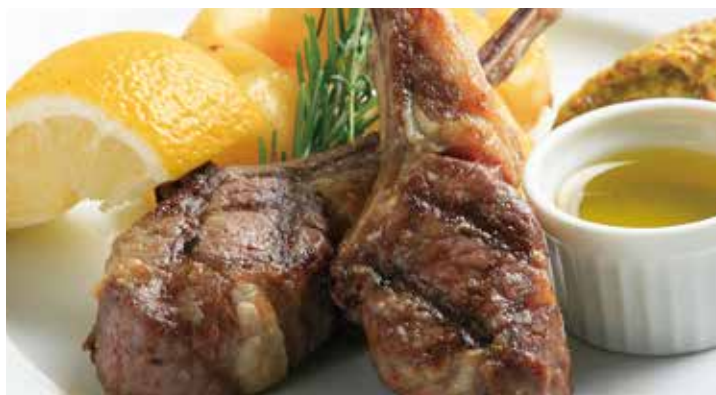
仔羊のラムチャップ グリル 2本 3,450 Grilled lamb (税込3,795)