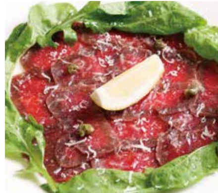
クジラ肉のカルパッチョ 1,640 Carpaccio of whale meat (税込1,804)

Sea bream carpaccio with avocado, radish and watercress salad with horseradish sauce