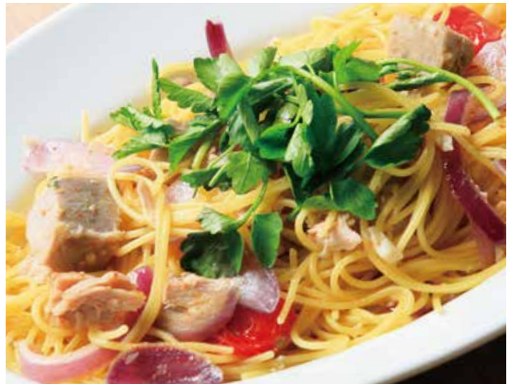
マグロの自家製ツナとクレソン 赤タマネギのペペロンチーノスパゲッティ 1,840 (税込2,024) Spaghetti with homemade tuna, watercress and red onion