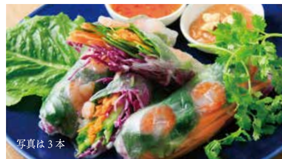
エビとバジル 野菜の生春巻き 1本 570 スイートチリとピーナッツソース (税込627) Shrimp spring rolls with sweet chili sauce and peanut sauce

3,391 (税込3,730) 丸ズワイ蟹 / ムール貝 / エビの コクテルソース / 牡蠣のラズベリー ピネガー / サーモンと帆立 アボカド