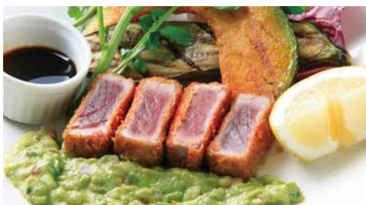
マグロのレアカツレツと 2,718 季節野菜のグリル アボカドのタルタル (税込2,990)

数十種類のスパイスや香味野菜でつくったペーストでチキンをマリネして高温のオーブンで焼き上げます