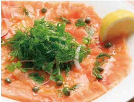
アトランティックサーモンの カルパッチョ デイルとレモン (税込1,705) Atlantic salmon carpaccio

大判の切り立てサーモンにハーブやレッドオニオン、 ケッパーを巻いてレモンをたっぷりかけてどうぞ！