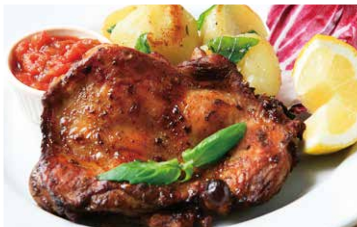
ジャークチキン バジルポテト 2,420 Jerk chicken and basil-fried potatoes (税込2,662)

数十種類のスパイスや香味野菜でつくったペーストでチキンをマリネして高温のオーブンで焼き上げます