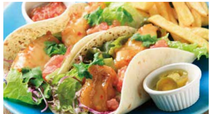
白身魚のフリット チリマヨソースのタコス 1,690 (税込1,859) Fried fish tacos with chili mayonnaise sauce