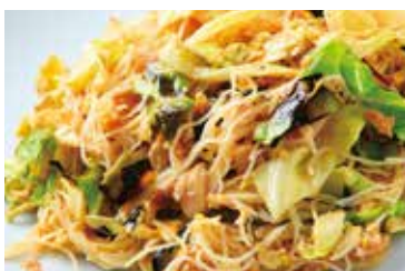
ツナとグリルキャベツの ベトナム風 ビーフン Rice noodles with tuna and grilled cabbage